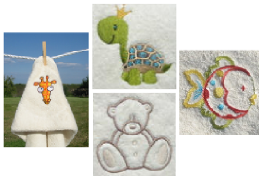
Cape de bain bébé unie ou brodée girafe, tortue, ourson, poisson

les capes de bain bébé sont confectionnées et brodées en France