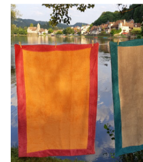
Drap de plage bicolore 100x150 cm abricot / framboise sable / bleu canard

le linge de bain Aquanatura est fabriqué en Turquie depuis 2002