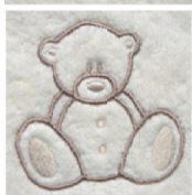
Cape de bain bébé unie ou brodée girafe, tortue, ourson, poisson