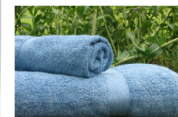
Petite production artisanale en teinture végétale à l'indigo naturel

une meilleure affinité pour la peau et un plus grand respect de l'environnement